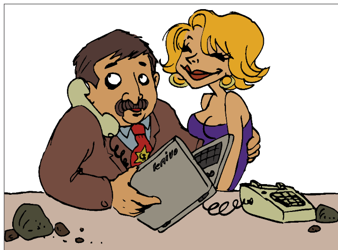
Štebáku, už balím, len ukončíme kapitolu diplomovky na bacsalazára...