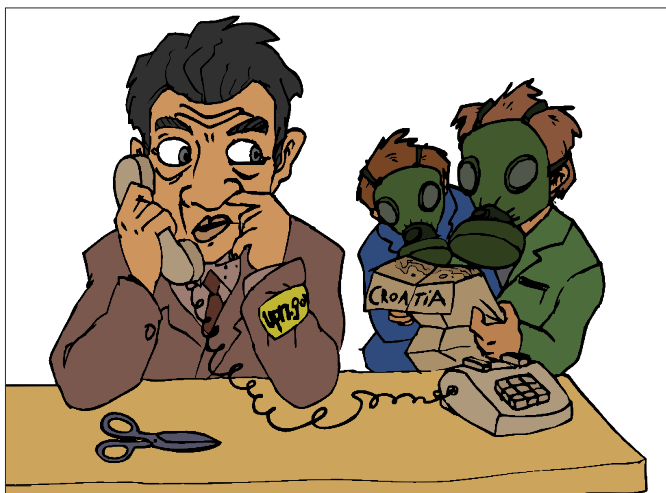
Balvan, sú tu súdruhovia z KAFIL100, idemo na výlet...

Tešíme sa na ďalšie stretnutie. Redakcia