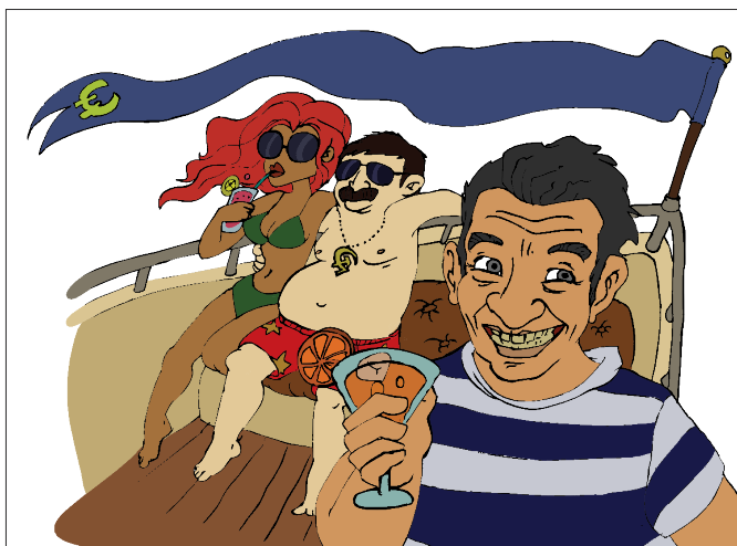
Chlapci, tu si oddýchnete. Na mori sa nedá urobiť žiadny... (dokončenie v tajničke)