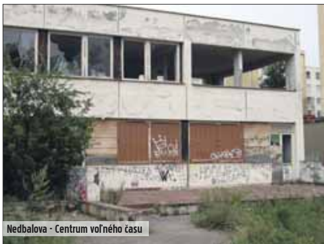
Nedbalova - Centrum voľného času